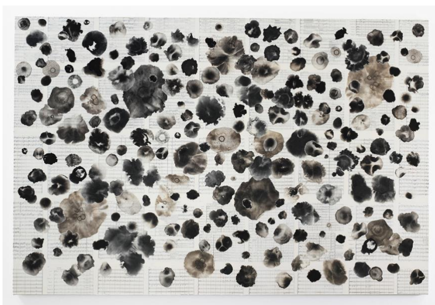
Tim Rollins and K.O.S., A Midsummer Night's Dream (after Shakespeare and Mendelssohn) , 2014, watercolor, ink, fruit juices, Thai mulberry paper, collage, mustard seed, music score pages on canvas, 48 x 72 inches, courtesy of Studio K.O.S. and Lehmann Maupin, New York, Hong Kong, Seoul, and London

Das Programm der Ausstellung umfasst Konzerte, Künstlergespräche in den Galerien, Vorträge und eine Seminarreihe des Direktors. Ein vollständig illustrierter Katalog mit Essays der Kuratoren und einer im Auftrag komponierten Partitur ist erhältlich. Der Katalog wurde durch eine anonyme Spende ermöglicht, und die Ausstellung wird durch einen Zuschuss der Claire Friedlander Family Foundation unterstützt.