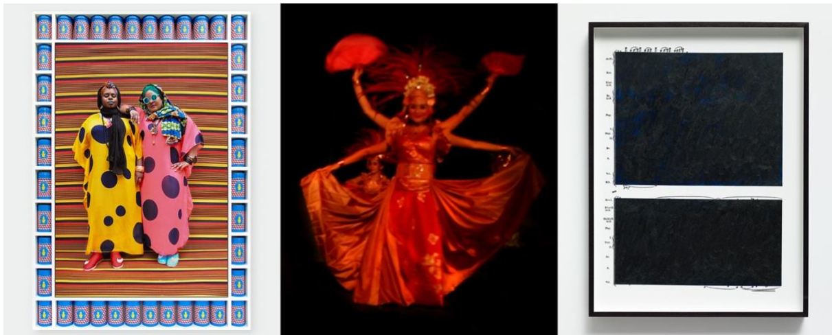
Hassan Hajjaj, Muneera & Sukina , Aka Poetic Pilgrimage 2016/1437 (Gregorian/Hijri), Metallic Lambda on 3mm Dibond in a Poplar Sprayed-White Frame with Blue, Image: 44" x 30", framed: 56" x 38 3/8" x 3 1/8" © Hassan Hajjaj, courtesy of Yossi Milo Gallery, New York | Bettina WitteVeen, Sparks Of The Deity , 2018, film still (detail), courtesy of Bettina WitteVeen | Idris Khan, Blue Rhythms , 2019, gesso and oil stick on 18 premier black and white fiber prints mounted on aluminum, 31 1/8 x 23 1/4 x 2 3/16 inches (framed, each) overall, framed: 66 1/4 x 241 1/4 x 2 3/16 inches, courtesy of the artist and Sean Kelly, New York

bekannten klassischen Musiker und Sammler von Kunst und raren Instrumenten Sean, David und Lauren Carpenter organisiert.