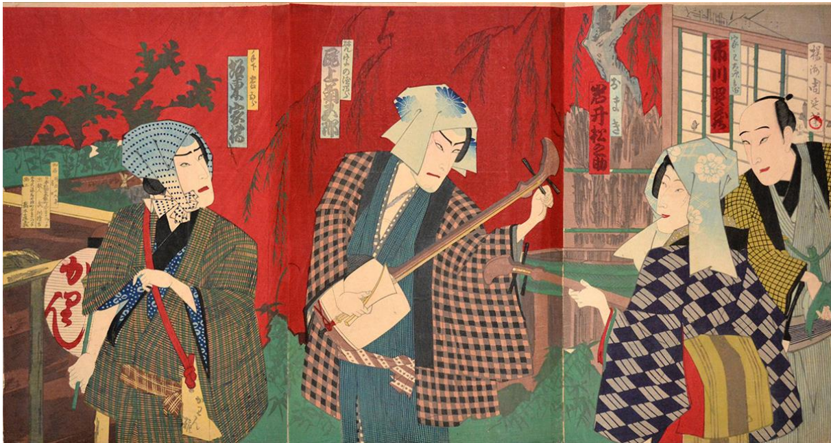
Chikanobu, Kabuki Play ; Onoe Kikugoro as Bonji no Kiyojiro and Iwai Matsunosuke as Omaki , 1886, woodblock, 14.25 x 27.75 inches, courtesy of Ronin Gallery, New York

Trommeln aus Afrika, eine Oud aus dem Nahen Osten und Harfen, Flöten und Saiteninstrumente aus den Ländern entlang der Seidenstraße zu sehen, von denen viele während der zahlreichen Konzerte und Vorträge, die während der Laufzeit der Ausstellung stattfinden, live im Museum gespielt werden.